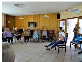
La gym douce