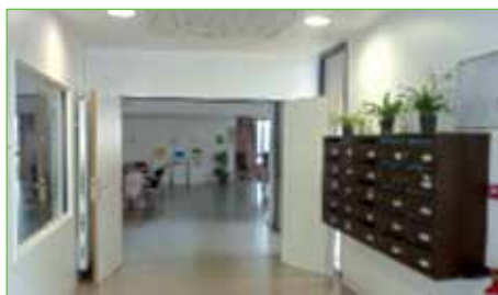
Votre boîte aux lettres personnelle se trouve à l'entrée de la MARPA.

La MARPA est couplée avec l'école du village : des espaces communs tels que la bibliothèque et la salle d'activités, vous sont ouverts à tous moments de la journée ainsi que les classes pour du calcul mental, la dictée, l'histoire, les arts, etc.